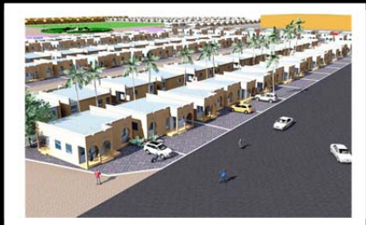
Situation : 2 e du concours